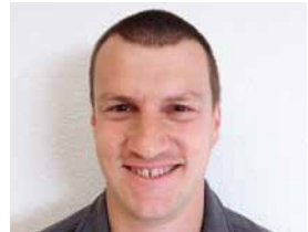
Jürg Knutti Detailhandel